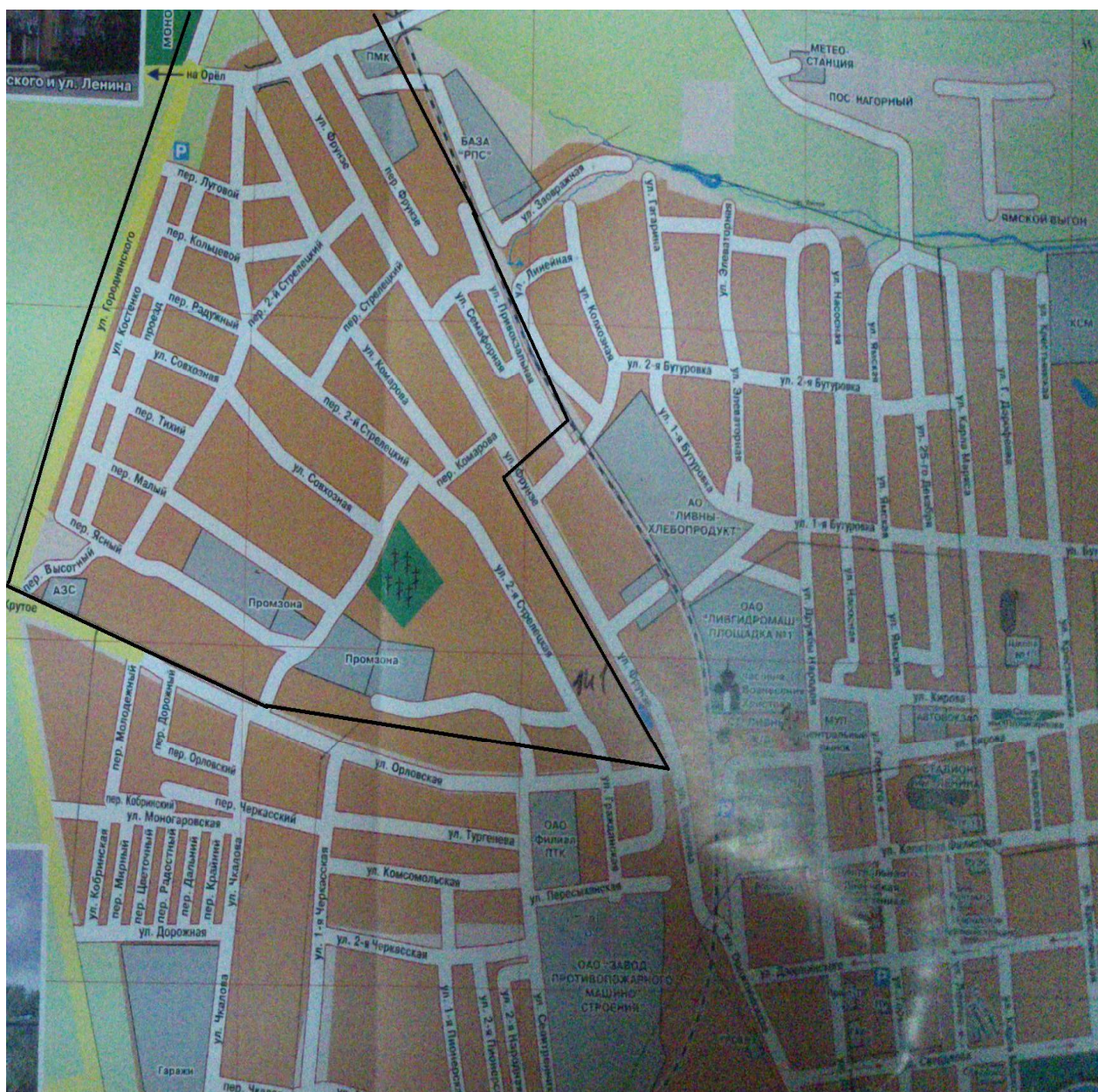
Схема расположения избирательного участка, участка референдума № 141