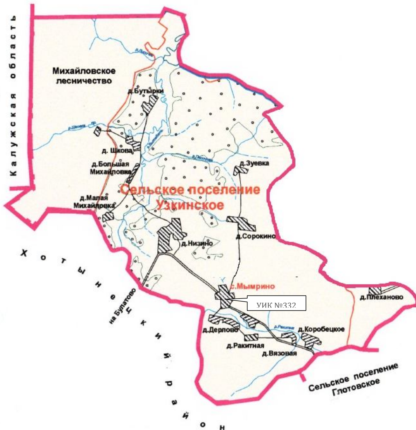
Схема расположения избирательного участка, участка референдума № 332