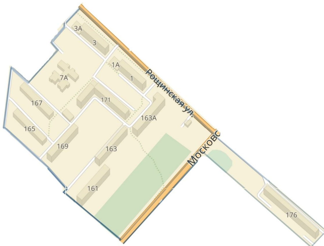
Схема расположения избирательного участка, участка референдума № 35