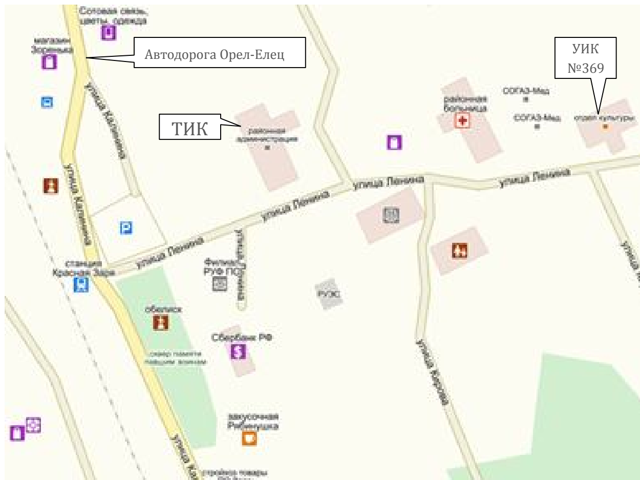
Схема расположения избирательного участка, участка референдума № 369