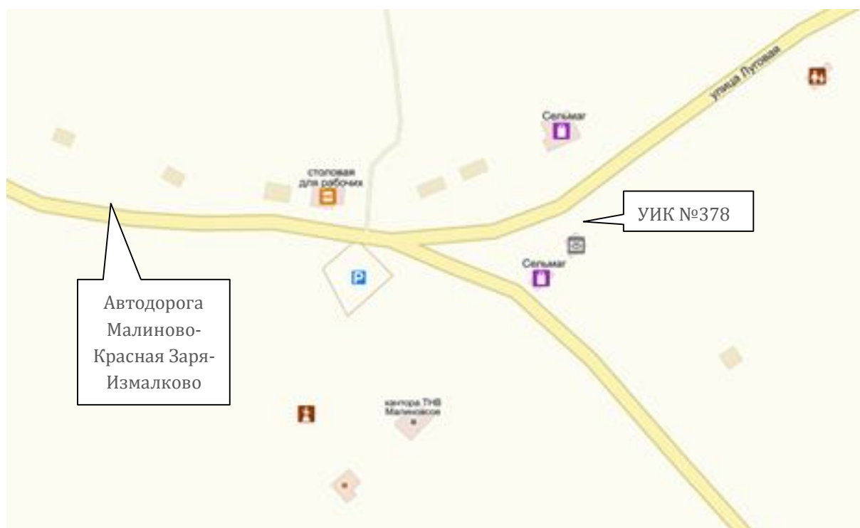
Схема расположения избирательного участка, участка референдума № 378