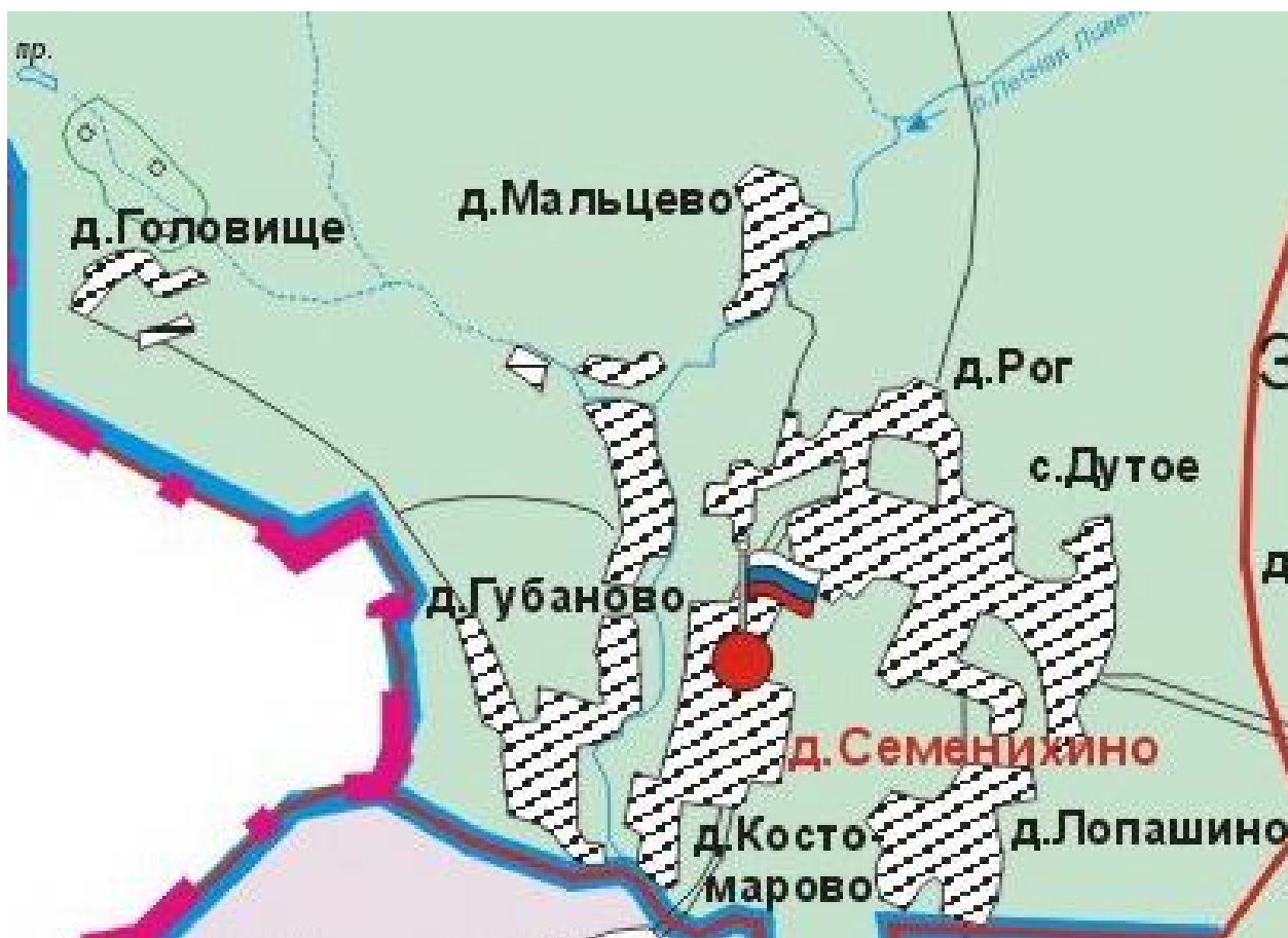
Схема расположения избирательного участка, участка референдума № 417