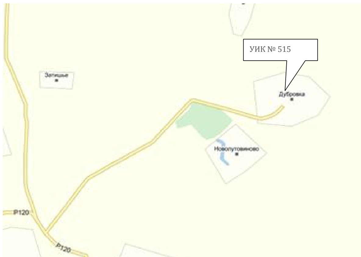
Схема расположения избирательного участка, участка референдума № 515