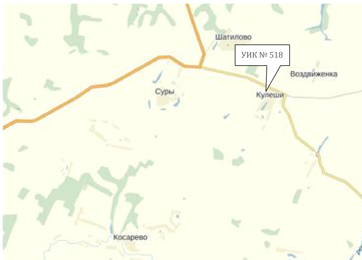
Схема расположения избирательного участка, участка референдума № 518