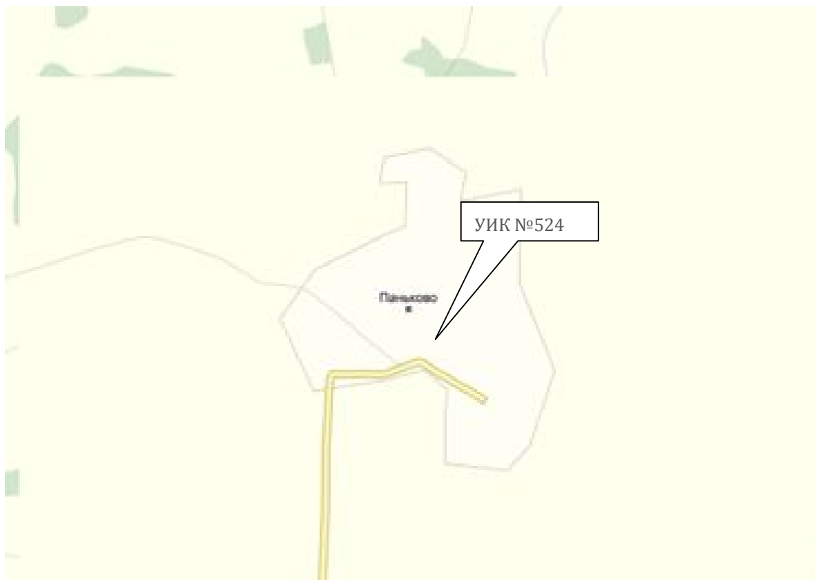
Схема расположения избирательного участка, участка референдума № 524