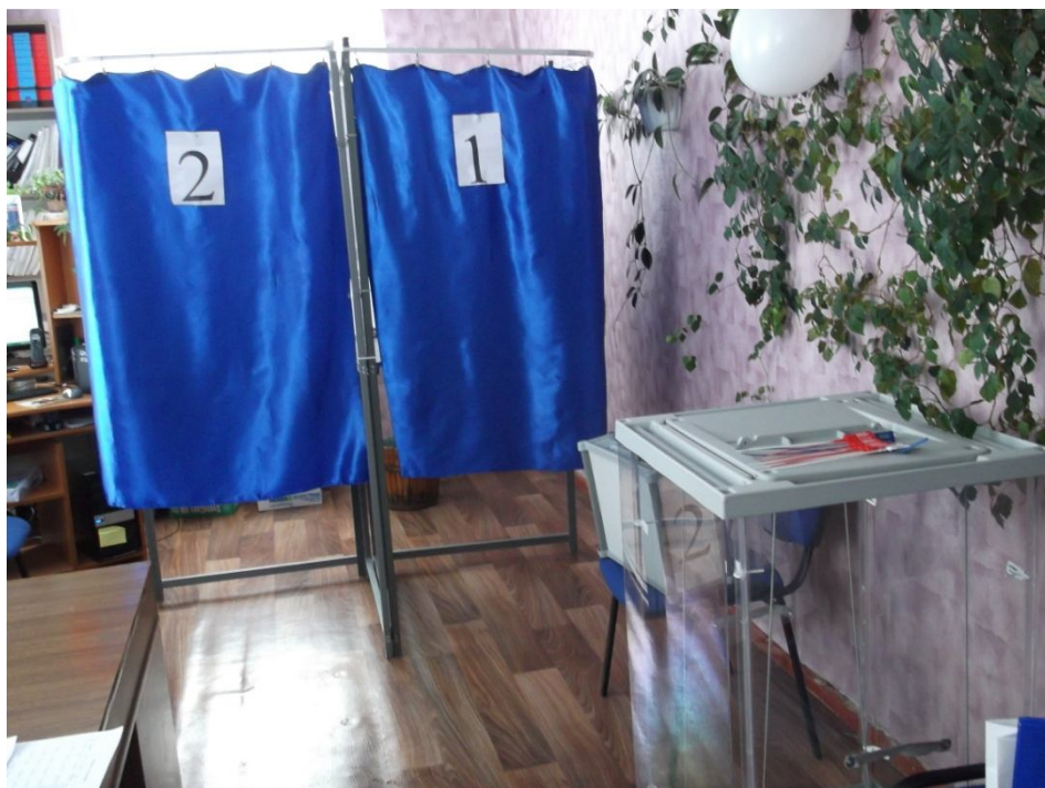
Сведения об избирательном участке, участке референдума