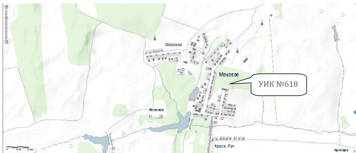
Схема расположения избирательного участка, участка референдума № 618