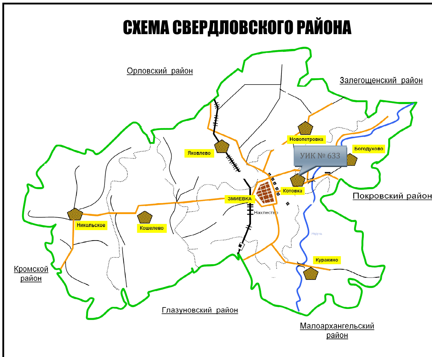
Схема расположения избирательного участка, участка референдума № 633