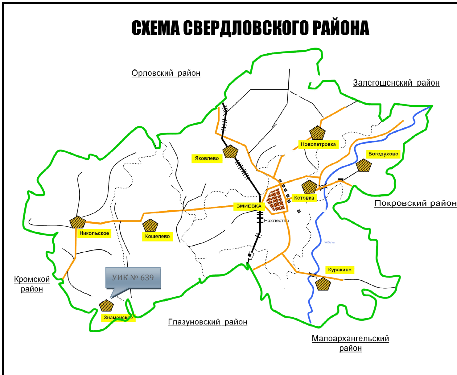
СХЕМА СВЕРДЛОВСКОГО РАЙОНА

Схема расположения избирательного участка, участка референдума № 639