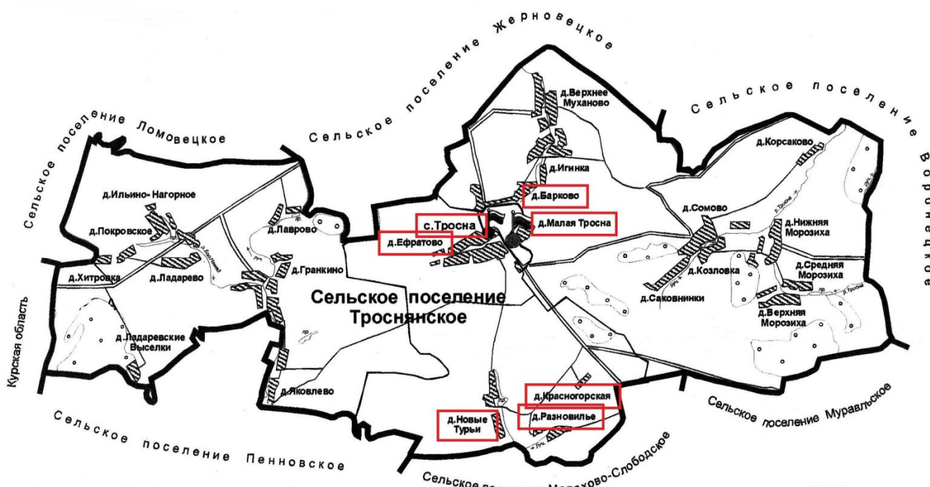
Схема и границы избирательного участка № 668, расположенного на территории Троснянского сельского поселения Троснянского района Орловской области