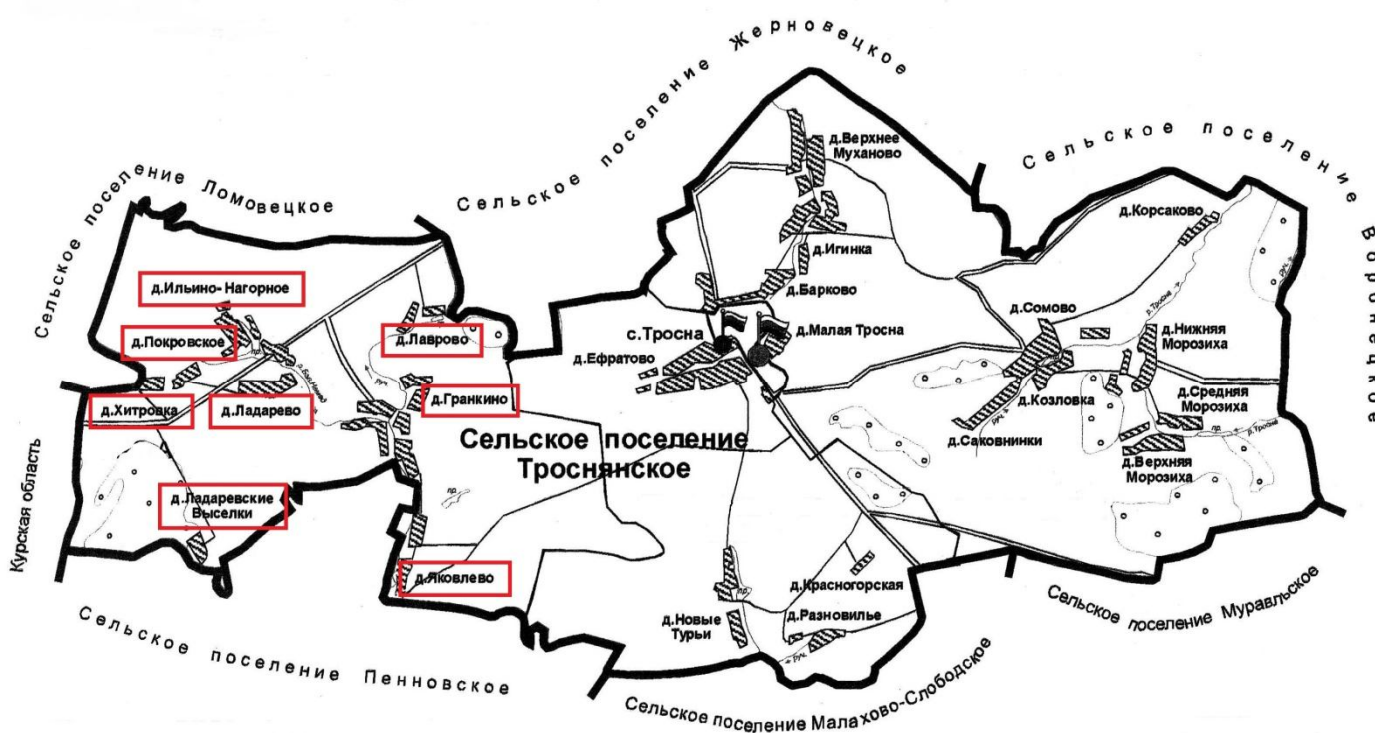
Схема и границы избирательного участка № 669, расположенного на территории Троснянского сельского поселения Троснянского района Орловской области