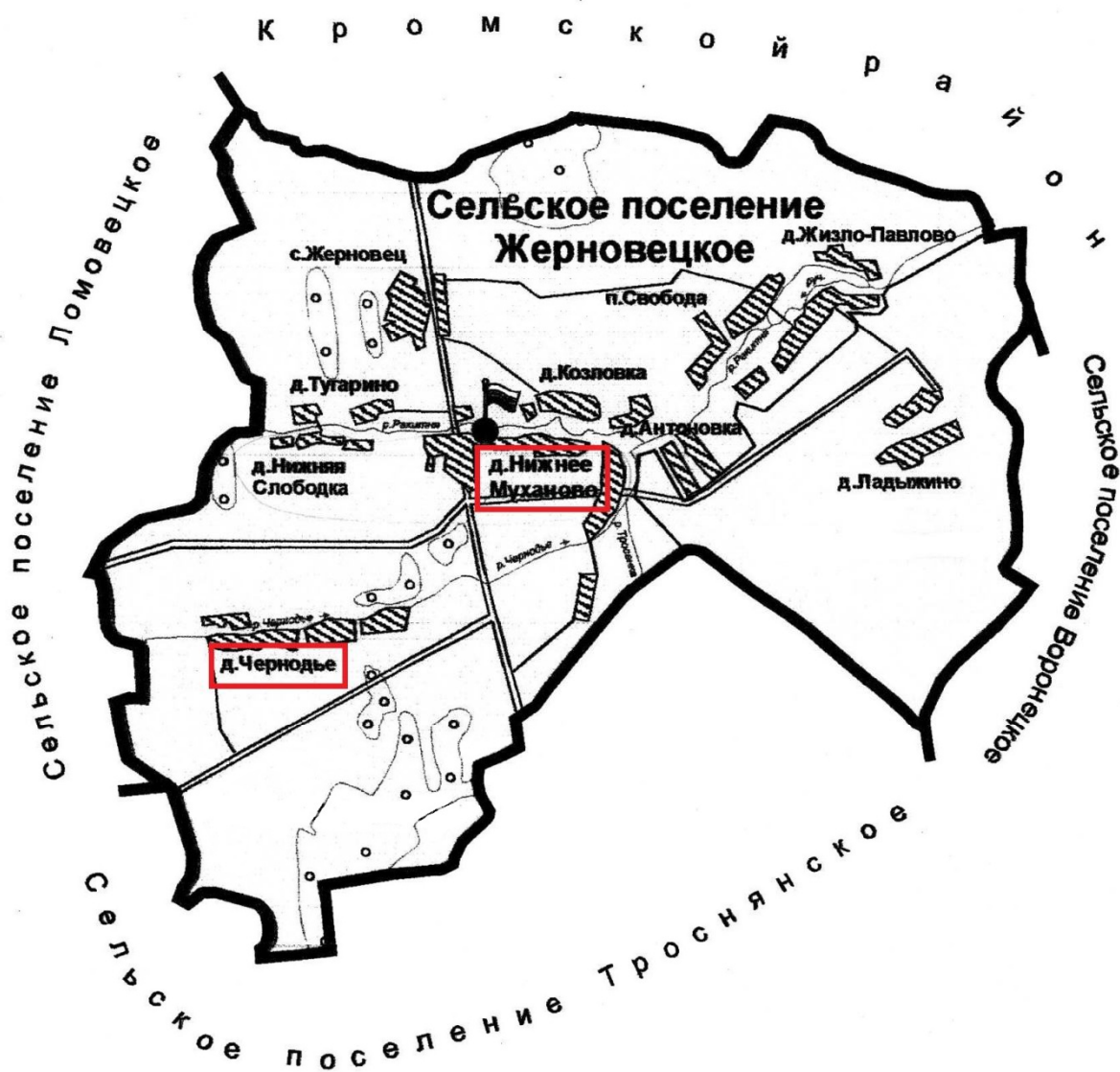
Схема территории и границы Жерновецкого сельского поселения Троснянского района Орловской области