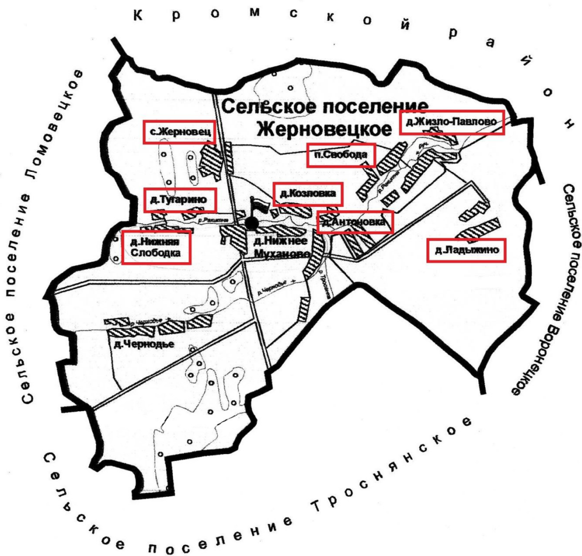
Схема территории и границы Жерновецкого сельского поселения Троснянского района Орловской области