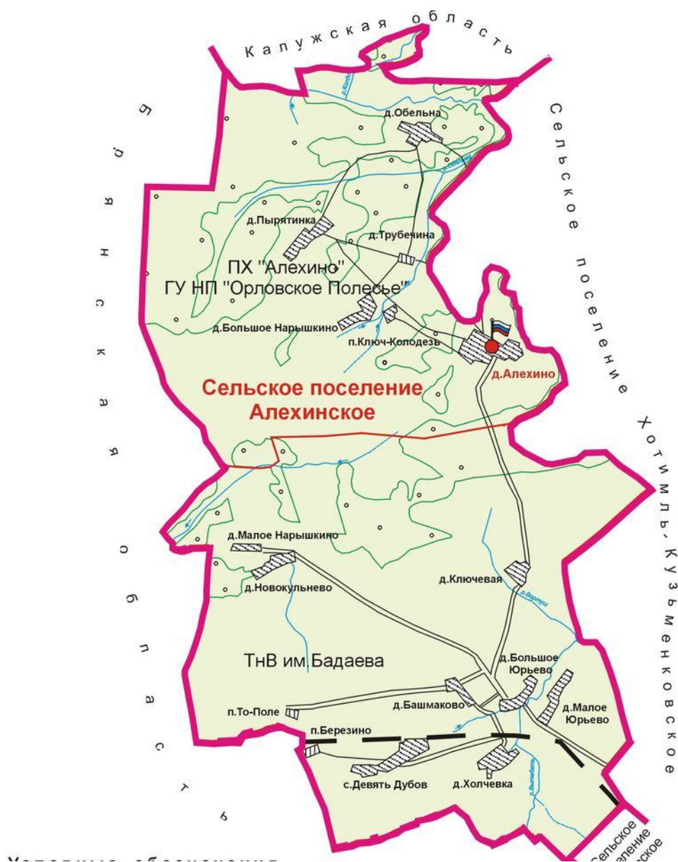
Схема расположения избирательного участка, участка референдума № 711