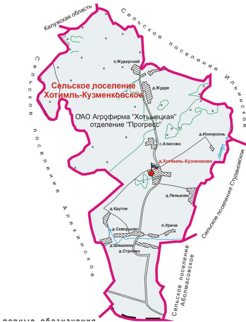
Схема расположения избирательного участка, участка референдума № 720